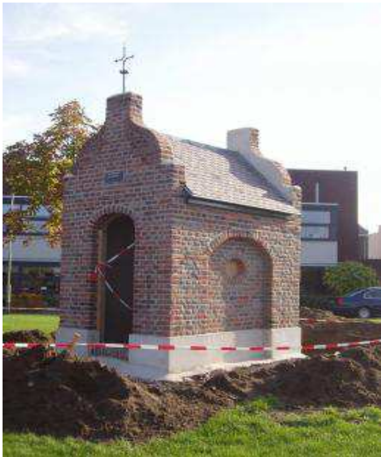
St.Antoniuskapelletje aan de Stationsweg

De subwijk St. Antoniusveld is na een lang voorbereidingstraject in de periode 1996 – 2002 gerealiseerd. De huidige wijk dankt zijn naam aan het St.Antoniuskapelletje dat langs de Stationsweg ligt. Het lag precies op grens van de parochie van Sint Petrus' Bandenkerk (Venray) met de oude heerlijkheid Oostrum. Het kapelletje is mogelijk rond 1650 gesticht door de Franciscanen, die een speciale verering hadden voor Antonius en deze verering ook bevorderden in de omgeving. In 2005 heeft men het kapelletje verplaatst naar een andere plek aan de Stationsweg. Op de hoek St.Servatiusweg/Henri Dunantstraat staat het St.Annakapelletje.